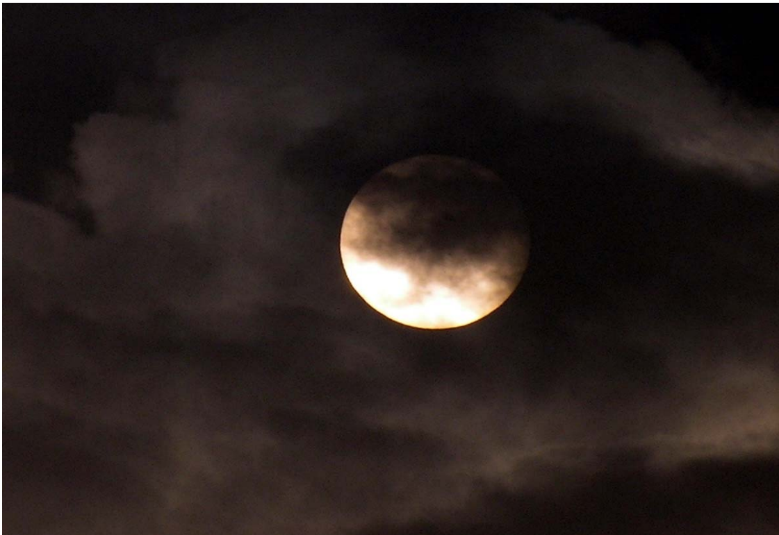
Oscuramento - Luciano Urbani – 1980

Un contenitore, un luogo di scambio di contributi diversi orientati alla riflessione autentica che permettano di disegnare percorsi ed obiettivi condivisi. Luogo d'incontro unico, quale occasione di pratica di pensiero, di appetito culturale, di approfondimento e di esercizio concettuale che permetta di intravedere spiragli di azione per migliorare il presente e progettare il futuro. Un movimento, che non rimane nel limbo dell'indistinto e dell'opportunismo ma si distingue per la qualità dell'impegno e si identifica in: "conoscere per comprendere, e coerentemente, scegliere per essere". Fucina di idee, crogiuolo di energie e motivazioni, palestra di riflessione. Una risposta possibile alla necessità di modificare la situazione attuale della professione infermieristica e la qualità dell'assistenza.